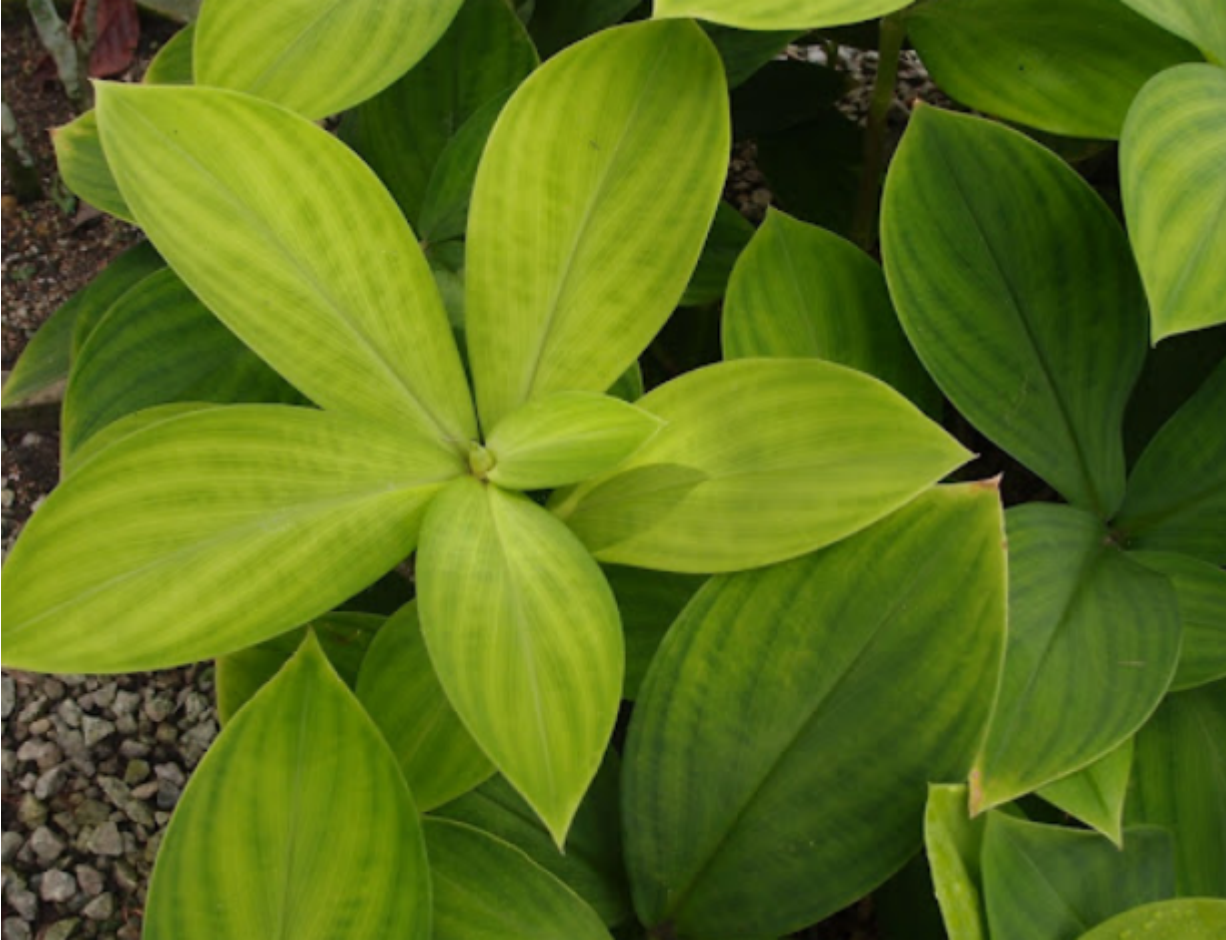
Pokok hempedu beruang ( Thottea grandiflora ) Sumber

Orang asli turut mempunyai kemahiran seni yang diwarisi dari zaman nenek moyang. Dedaun serta pucuk-pucuk tumbuhan digunakan untuk membuat aksesori atau perhiasan semasa majlis keramaian. Sebagai contoh, semasa melakukan tarian Sewang , para penari akan menghiasi diri mereka dengan selempang dan setanjak yang dianyam daripada daun kelapa dan dililitkan di kepala, pinggang atau dada. Persembahan Sewang ini kemudiannya diiringi persembahan dengan alunan irama buluh cehtong yang mempunyai corak ukiran yang menarik dan berbunyi merdu.