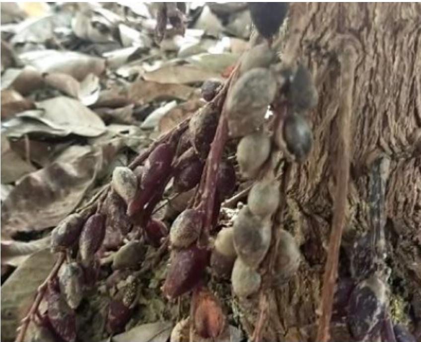
Setambun merah ( Baccaurea parviflora )

Satu penyelidikan telah dijalankan oleh beberapa penyelidik daripada Universiti Malaya pada tahun 2012 untuk mengkaji penggunaan tumbuhan dalam perubatan tradisional orang asli suku Semai di Perak ( sumber ). Dapatan kajian ini menjelaskan bahawa, pokok dukung anak ( Phyllanthus urinaria ) sangat berkesan untuk merawat demam kuning.