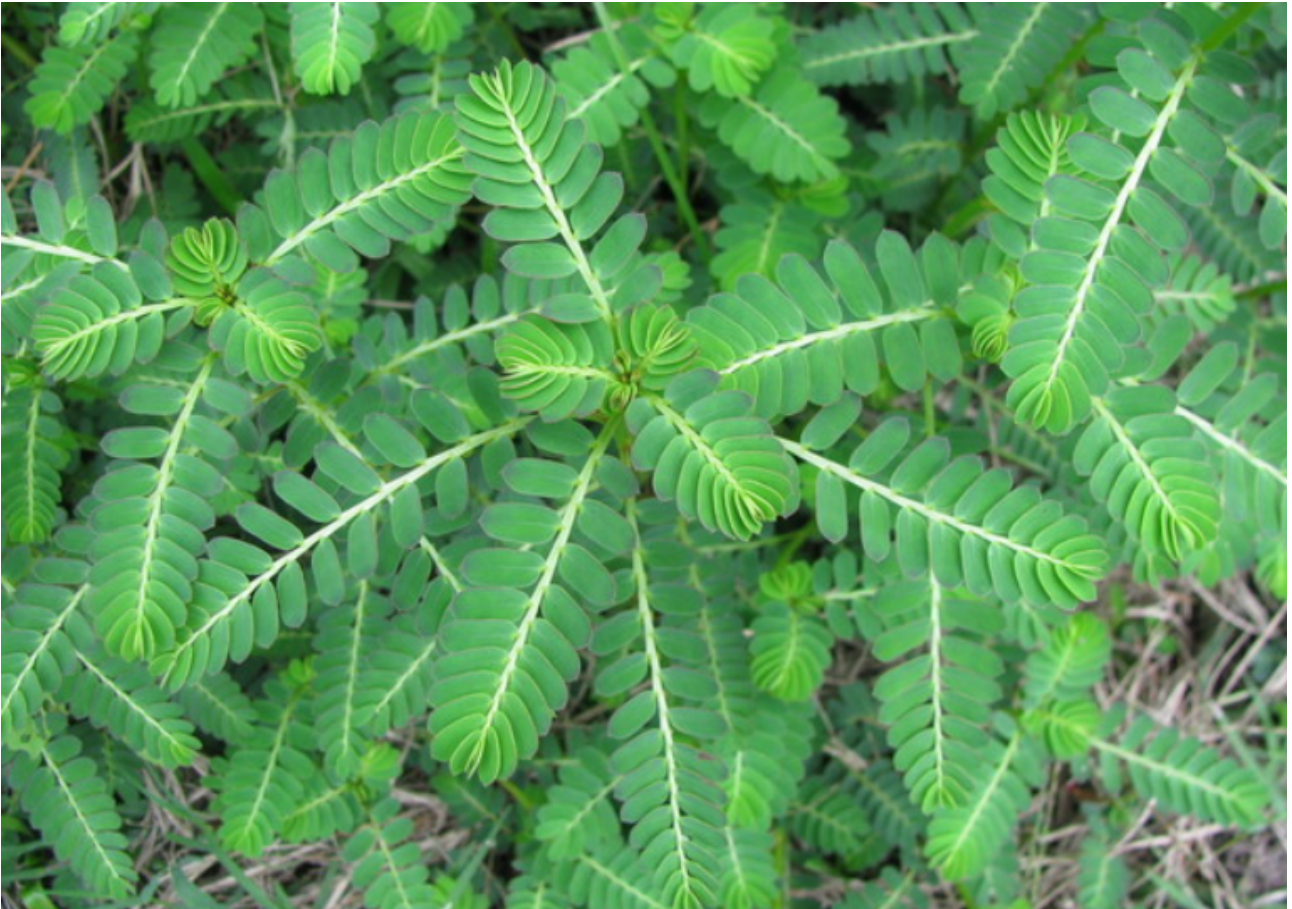
Pokok dukung anak ( Phyllanthus urinaria )

Namun begitu, pemilihan herba untuk merawat penyakit ini turut dipengaruhi oleh kepercayaan serta pantang larang yang diwarisi daripada nenek moyang terdahulu untuk memastikan penyakit itu dapat disembuhkan.