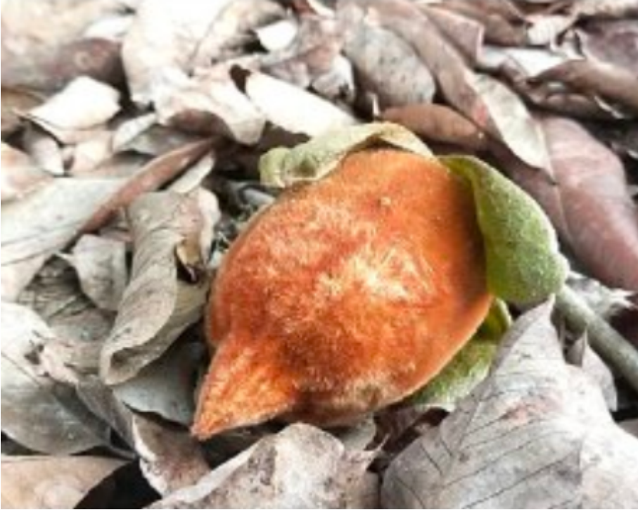
Bedil lalat ( Diospyros argentea )